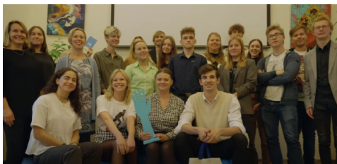
noderīga 1. oktobrī.

Dalībnieku atsauksmes par pasākumu ir ļoti pozitīvas, viņi uzsver patīkamo, nesapringto un mierīgo pasākuma gaisotni, kas ļāva justies brīvi un aktīvi iesaistīties. Vidusskolēni izklaidējās un radoši izpaudās video darbnīcā un apgalvo, ka informācija, ko ieguva par vēlēšanām, bija